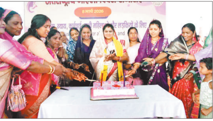
केक काटती महिलाएं।