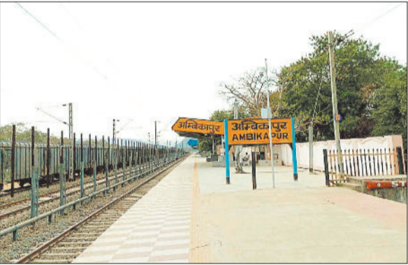
अम्बिकापुर रेलवे स्टेशन।